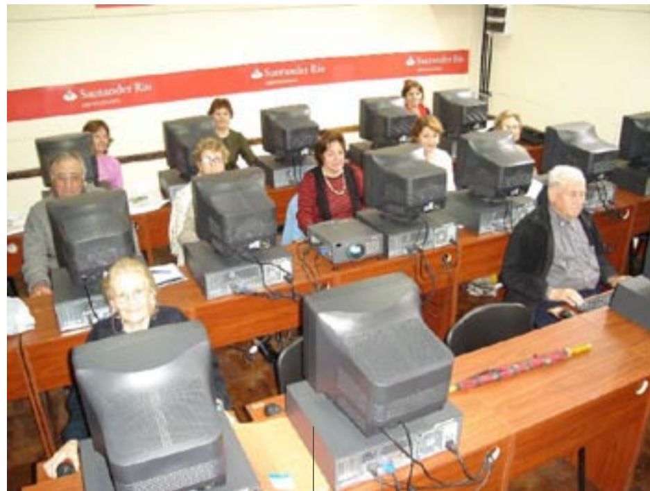
Alumnos del curso de computación desarrollado en Santa Rosa, un ejemplo de entusiasmo y tesón para aprender.