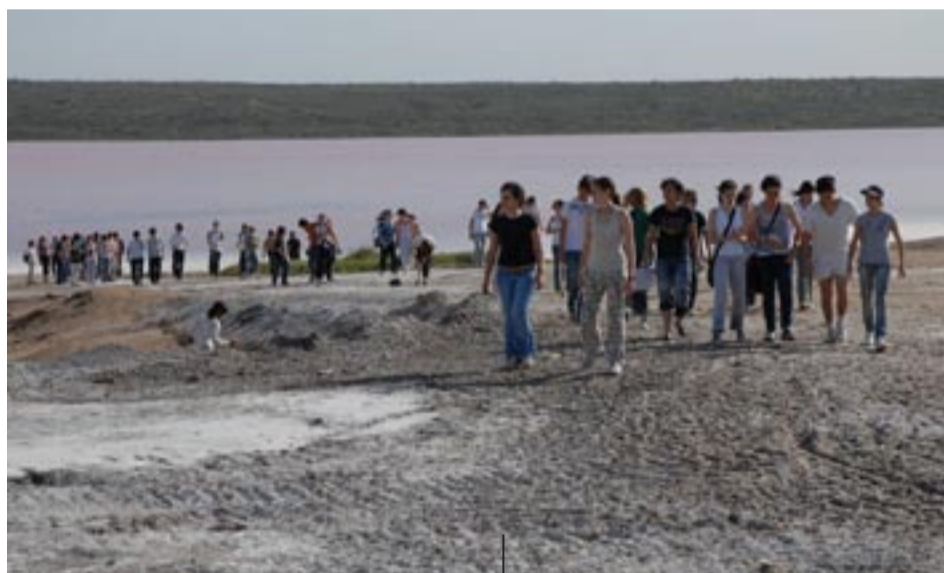
Los estudiantes durante su visita a las salinas.

En el marco del proyecto “Conocemos y valoramos el patrimonio histórico y ecológico provincial”, alumnos de octavo primera y segunda del Colegio de la UNLPam realizaron un viaje de estudio a Jacinto Arauz en el que, durante dos días -el 21 y 22 de noviembre-, visitaron la salina “La Colorada Chica” y recorrieron los lugares por donde transcurrieron los días como médico rural del célebre René Favaloro.