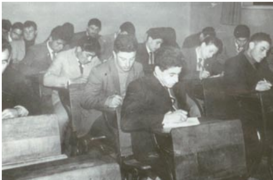
Aula de la Escuela N° 2 (de niñas) donde, en los primeros años de esta Universidad, se dictaron las distintas asignaturas de las carreras de Ciencias Económicas y Agronomía. Año 1960.

El 4 de septiembre de 2008 la Universidad de La Pampa cumplirá 50 años desde su creación, motivo por el cual la Secretaría de Cultura y Extensión Universitaria convoca a un concurso para el diseño de un isologo por el cincuentenario de la institución, que pasará a formar parte de la papelería y las piezas gráficas durante el próximo año.