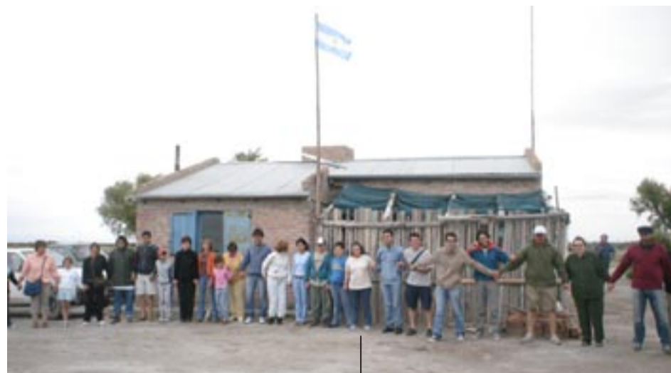
"Puesteros y Puesteras del Oeste de La Pampa: reclamamos por la tierra y conflicto social", un proyecto de extensión solidario.

Una Comisión Evaluadora Especial del Consejo Superior, integrada por un